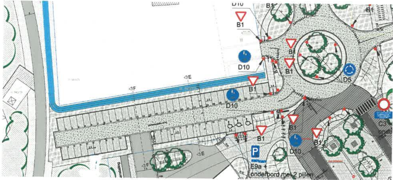
Bijlage 3: parking tussen rotonde Baron de Taxislaan en Sint-Jacobstraat