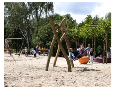
Sport- en speelpark Boneput