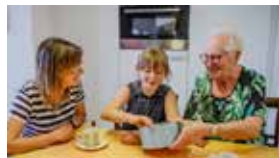
Triamant is als een dorp in de stad: generaties leven er door én met elkaar.