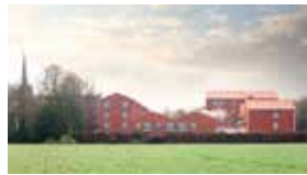
Triamant Bree combineert gerenoveerde kloosterflats met nieuwbouwflats voor jong en oud.

er kunnen wonen op elke leeftijd. Bij het ontwerp is rekening gehouden met de specifieke behoeften en beperkingen van oudere mensen, zodat zij zo lang mogelijk zelfstandig kunnen blijven. Ageing in place is in deze woon- en leefbuurt mogelijk: zo lang mogelijk thuis wonen.