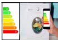
Nieuwe energie labels vanaf 1 maart 2021