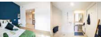
De comfortabele flats zijn huiselijk en houden discreet rekening met mogelijke beperkingen omwille van ziekte of ouderdom.

Maar ook jongere mensen vertoeven graag bij