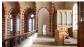
De kloosterkerk is ontwijde en kan gebruikt worden voor diverse doeleinden: van musicalrepetities over familievieringen tot bijeenkomsten van het buurtcomité.

Triamant Bree. Er is een leuk speelterrein en een panna-voetbalveld voor kinderen die graag ravotten. De ontwijde kloosterkerk wordt een hippe, multifunctionele ruimte, die een andere invulling kan krijgen naargelang de vragen en behoeften. Een communiefeest organiseren? Of een zangrepetitie met het koor? Een bijeenkomst met de burens of met lokale boeren? Alles is bespreekbaar. Het is aangenaam wanneer rust en gezellige bedrijvigheid mekaar afwisselen.